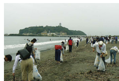
▲クリーンキャンペーンの様子

このほかにも「自然観察会」「親子体験イベント」などの活動を通じて、環境の保全と地域社会との交流に努めています。