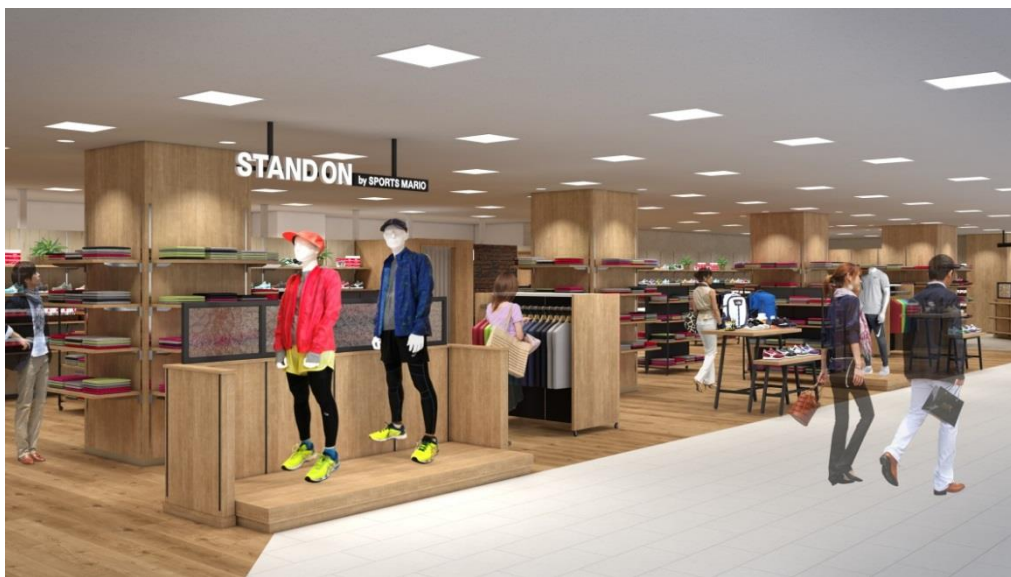
▲3階『スタンドオン by スポーツマリオ』(イメージ)