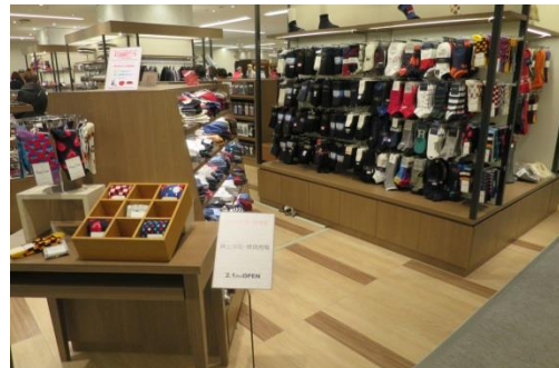
▲先行オープンした「紳士洋品・雑貨売場」