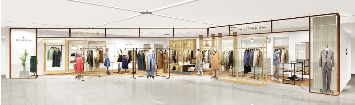
▲3階『ドレステリア』(イメージ)