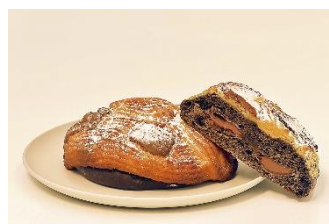
▲ 『OZ とハルコの旅するベーカリー』