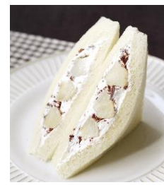
▲ 『ブロッサム&ブーケ』