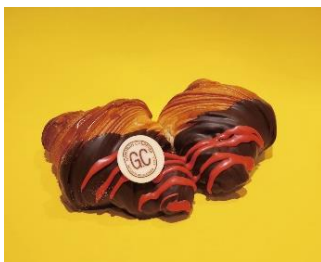
▲ 『ゴントラン シェリエ』