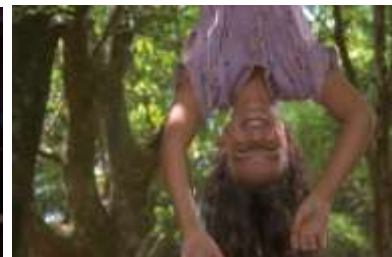
▲『秘密の学校』(The Scarecrow Girl) ＜サイドシアター★大事なものに 気づけるプログラム＞