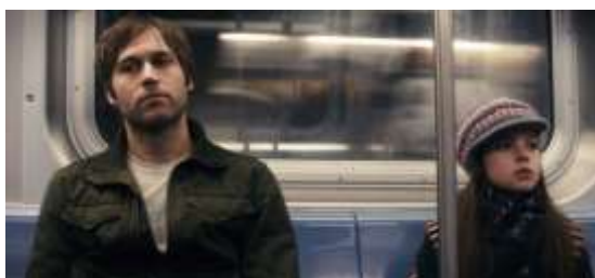
▲『リッチーとの一日』(Curfew) 第85回米国アカデミー賞 短編実写映画賞受賞 ＜フロントシアター★世界最高峰のプログラム＞