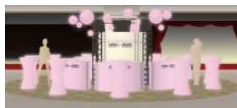
▲会場の中央に「光カウンター」を設置。 カウンター上のモニターで上映される 作品を楽しみながら、飲食できる