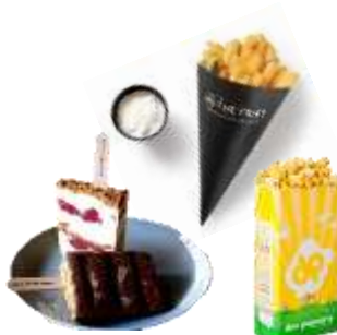
▲映画のお供に！話題の フィンガーフード