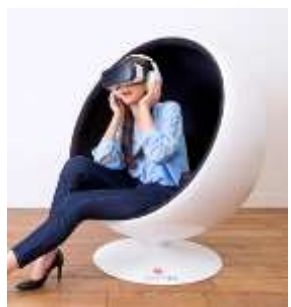
▲人気コンテンツが楽しめる ＜VRシアター（有料）＞