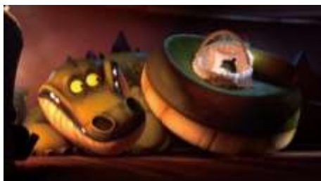
▲『僕のかわいいクロコ』(My little Croco) ＜フロントシアター★世界のアニメーション プログラム＞