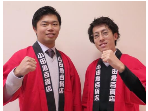
▲平成生まれの販促担当者が企画しました！

＜販売日＞2019年1月2日（水） ※一部応募型の夢袋がございます。 ＜販売場所＞新宿店本館・ハルク各売場