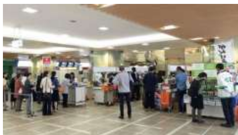
▲本館1階中央口前特設会場のイメージ