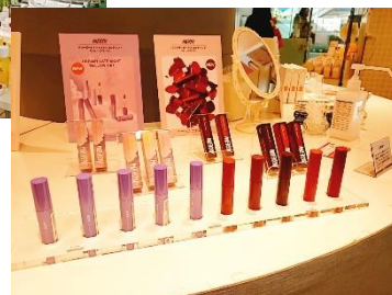
▲新宿小田急「韓国コスメ POP-UP SHOP」展開の様子