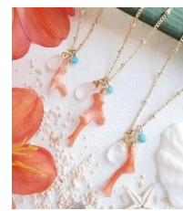
▲『アトリエシー』アクセサリ

そのほか、リリコイやマカダミアチョコなど上質な材料でしっとり食感に仕上げた『アロハケーキ』のパウンドケーキや『ハナリマ』『アトリエシー』が出店し、ハワイアン雑貨やアクセサリを販売します。