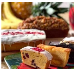
▲『アロハケーキ』パウンドケーキ

レジン(樹脂)を使用し、海や自然をモチーフにしてハワイの美しい魅力を伝える人気アーティスト、サラ カードル。作品のなかではハワイの海の色や波の動、砂の色などがキラキラとした宝石のように輝きを増すことから、“宝石を描くアーティスト”と賞賛されています。会場では、2021年に惜しまれつつもアーティスト活動を休止したサラ カードルのレジンアート(版画)を展示販売するほか、ベギー ホッパーやマーガレット ライスなどハワイを描くアーティストの作品も展開します。