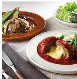
▲&lt;賛否両論×オステリアルッカ東4丁目&gt;