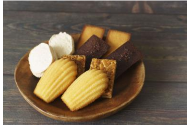
▲デパ地下スイーツ（イメージ）

小田急百貨店町田店のデパ地下ショップから 3,000 円相当のスイーツを毎月お届けします。1 月は新規オープンの『ラ・マーレ・ド・チャヤ』から、2 月は『麻布かりんと』からお届けします。3 月以降は届いてからの楽しみ。さらに「スイーツクーポン（10,000 円分）」付きです。