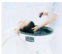
▲ヘッドスパ（イメージ）

2024年の「24（ニシ）」にちなんで、「新宿西（ニシ）口ハルク」を巡ってまるごと美しく。ハルク地下1階の小田急百貨店化粧品売場とハルク7階の美容室やエステなどさまざまなビューティーアップ体験を贅沢にひとり占めできる夢袋です。