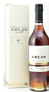
▲ヴィンテージブランデー（ジェラス 60 年）