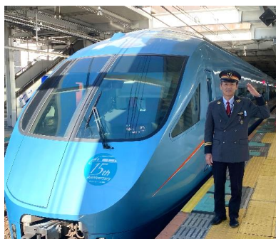
▲小田急線町田駅で駅長体験（イメージ）

小田急線町田駅で、お子さまが制服を着用して電車の出発指示合図体験や記念撮影のほか、普段は入ることのできない駅施設の見学をしていただけます。さらに、ロマンスカーミュージアムでは、実写映像を見ながらリアルな操縦体験が楽しめる運転シミュレーターにて運転士体験も。体験終了後にはロマンスカーミュージアム内のレストランにてご家族でランチをお楽しみいただけます。