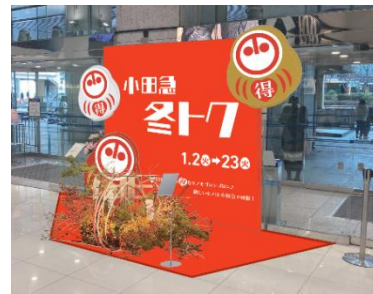
▲1階正面入口の装飾イメージ