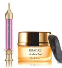
▲『グラティエ』（イメージ）