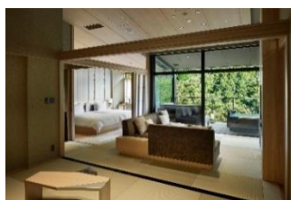
▲『はつはな』客室（イメージ）