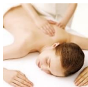
▲ボディエステ（イメージ）