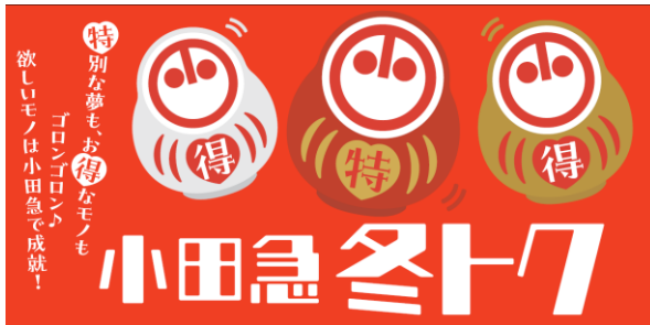
▲「小田急 冬トク」を初開催

小田急百貨店では、2024年1月2日（火）から全店で開催する「小田急 冬トク」企画の一環として、12月20日（水）からお得に特別な体験が楽しめる「2024年小田急スペシャル夢袋」の応募抽選の受付を各店店頭にてスタートします。今年で23回目を数え毎年人気のお子さまが駅長体験をできる恒例企画のほか、今年は新たに箱根の旅を満喫できるプランや美容体験、デパ地下スイーツ企画が登場します。