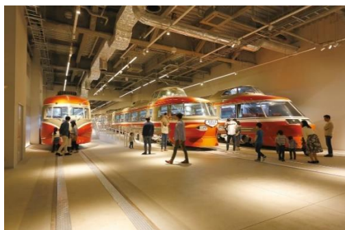
▲ロマンスカーミュージアム（イメージ）