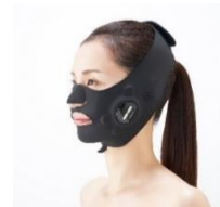
▲メディアリフト（イメージ）