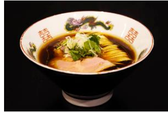
▲ネオトーキョー醤油ラーメン 1,300 円

水道橋に店舗を構える、天才ラーメン職人、居山店主が率いる『八咫烏』が〈#新宿地下ラーメン〉に再登場。“伝統とアバンギャルド”をモットーに、現代ラーメンの最高峰をお見せします。