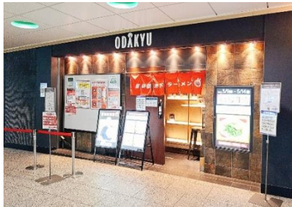
▲新宿駅西口地下街の〈#新宿地下ラーメン〉

12 月 1 日に 3 周年を迎えることを記念して、ラーメンファン待望の名店が再登場します。12 月 1 日(月)～6 日(土)の期間、〈#新宿地下ラーメン〉記念すべき出店第 1 号店舗の『ゴールデンタイガー』と、『トーキョーニューミクスチャーヌードル 八咫鳥 CHIKARABO』が期間中入れ替わりで出店します。普段はお店まで足を運ばなければ味わえない大人気店の逸品を、新宿で味わえる貴重な機会です。