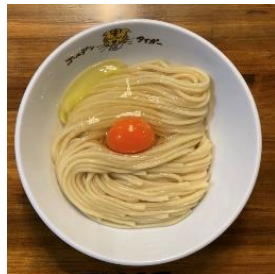
▲元祖 TKM 700 円（3 周年記念価格）

埼玉県熊谷市で連日行列を生む『ゴールデンタイガー』は、いまや全国に広がる新ジャンル「TKM（たまごかけめん）」の発祥店です。〈#新宿地下ラーメン〉の記念すべき第 1 店舗目として出店した歴史を持つ特別な存在。今回は 3 周年を祝し、看板メニュー「TKM」を特別記念価格 700 円で提供します。