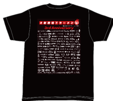
▲122 店舗のロゴ入り（裏）※画像はイメージです。