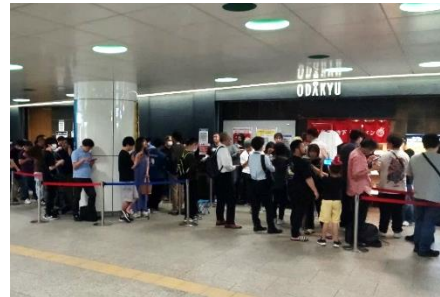
▲人気店には行列も

期間限定で全国の“押し麺”を提供する〈#新宿地下ラーメン〉は、新宿駅直結の地下街という好立地からラーメン好きの方だけでなく、平日には男女問わずランチタイムや仕事帰りに立ち寄る新宿西口のオフィスワーカーが来店し、多い時には 100 人を超える行列ができるなど、新宿のラーメンスポットとして注目されています。