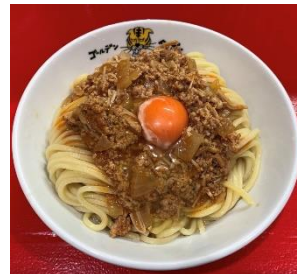
▲TKM みーの味 1,500 円 ※各日限定 50 食

麺と卵とタレのみの「TKM」。麺のすすり心地を感じながら、麺のおいしさをシンプルに味わうところにフォーカスして食べていただくメニューです。また、ゴールデンタイガーの超希少限定メニュー、自家製ミートソースを乗せた「みーの味」も登場。店主金澤が愛したミートソース系 TKM の金字塔、各日 50 食限定です。