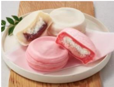
▲札幌市『めめ』紅白おやき 400円/1セット(2個入り)【2週目】

いよいよ5月1日に幕開けとなる「令和」。2週目からは新時代スタートへのお祝い気分を盛り上げる限定品が登場します。おめでたい紅白カラーがてみやげにも喜ばれる『めめ』の「紅白おやき」のほか、『食堂丸善』では看板メニューのうにめしととこぶしやカニなど海の幸を1折で堪能できる限定弁当を販売。『市場めし 兆 KIZASHI』の4つに仕切られた、海鮮を贅沢に盛り合わせたお弁当はご家族や友人とシェアして味わうのにもおすすめです。