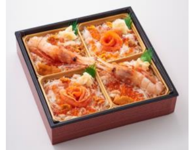
▲札幌市『市場めし 兆 KIZASHI』祝兆弁当 3,240円/1折(各日限定30折)【2週目】