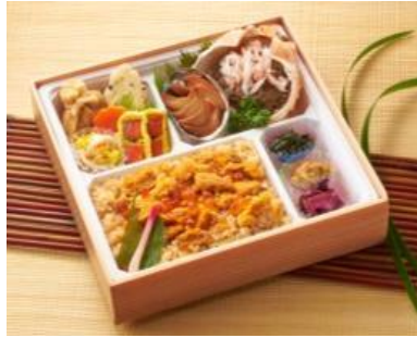
▲利尻富士町『食堂丸善』新元号特別うにめし弁当 2,916円/1折(各日限定30折)【2週目】