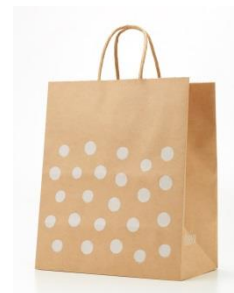
FSC®森林認証の認証基準に基づき適切に 調達された紙を使用