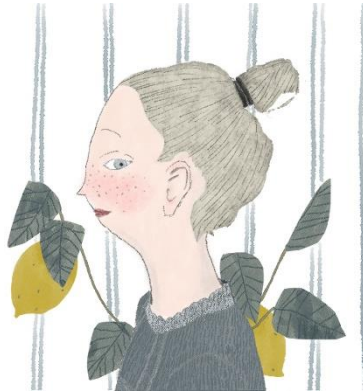
▲ 『Sohhei Numata』 場所：クリエイタリエ 期間：5月26日(水)～6月15日(火)