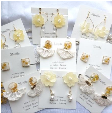
▲ 『31mile』 場所：ベッピンデコ 期間：4月7日(水)～20日(火)